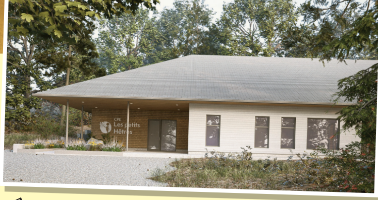
Voilà à quoi ressemblera le futur CPE.