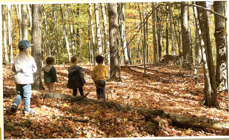
Les enfants rencontrent un chevreuil dans la forêt.

Le CPE a très hâte de s'installer dans la communauté et de continuer à offrir aux familles un milieu de vie chaleureux, inclusif et profondément humain, où chaque enfant peut h.êtrre et grandir en lien étroit avec la nature. Plusieurs idées de services connexes sont également en incubation (halte scolaire pour les grands frères et grandes, cantine santé, friperie, etc), et l'équipe les partagera avec la population au fil de leur développement.