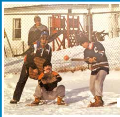
Baseball en raquettes, 1983.

Pour répondre aux nouveaux besoins de la population, on bâtit en 2013 des équipements modernes au cœur du village: le CHALET DES LOISIRS avec son vestiaire, des toilettes et une salle de détente avec vue imprenable sur la patinoire; un PLATEAU SPORTIF éclairé efficacement mais dans le respect de la protection du ciel étoilé, lequel comprend en hiver une patinoire et en été un court de tennis , des paniers de basketball et un espace où on peut pratiquer le hockey-balle et le patin à roues alignées .