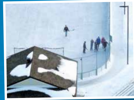
Le Chalet des loisirs et la patinoire.

Les activités de loisirs ont bien évolué au cours du temps. Dans les années 1900, on se servait avant tout des emplacements naturels à proximité, avec les moyens du bord: patin sur le lac, traîneau, etc. Puis le temps passe et les activités se diversifient: danse dans les auberges et salles de divertissement, ski de fond, sports d'équipe... les moyens de communication aidant, une grande variété de loisirs est maintenant disponible.