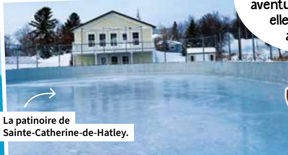
La patinoire de Sainte-Catherine-de-Hatley.